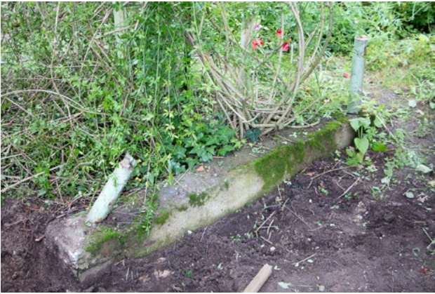
Randbefestigungen gab es auch am Schuppen vom Nebengebäude.