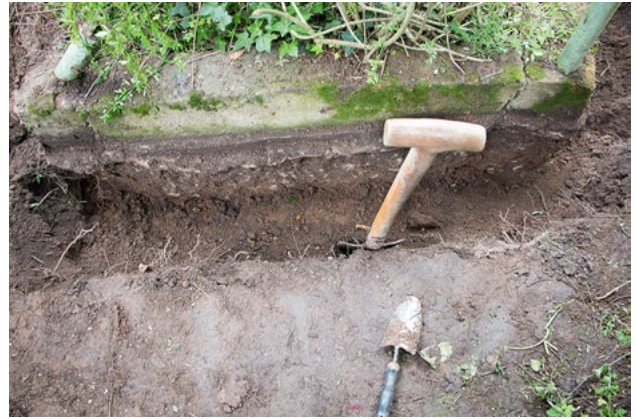
Auch das musste weg! Ohne zu graben ging das aber leider nicht.